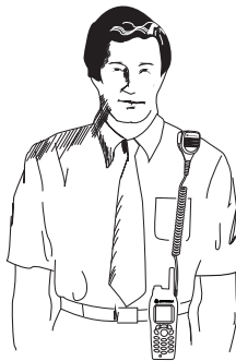
Figura 1. Instrucciones para llevar el accesorio

Para obtener un rendimiento óptimo del RSM, coloque el radioteléfono y el RSM de modo que el cable auxiliar no se cruce o toque la antena. Asimismo, intente colocar la radio y el accesorio próximos entre sí para evitar que se produzca tensión en el conector de accesorios.