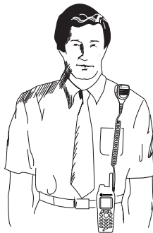
Figura 1. Utilização do Acessório

Para obter um óptimo desempenho do RSM, utilize o rádio e o RSM de modo a que o cabo do acessório não passe por cima nem toque na antena. Além disso, tente usar a combinação do rádio e acessório muito próximos um do outro para evitar tensão na ficha acessória.